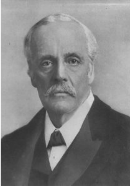
Arthur Balfour.

Denne delen av erklæringen var ikke sionistene så veldig fornøyd med for 100 år siden, og de har for ettertiden valgt å ignorere det fullstendig. Forståelig nok, da rettigheter for palestinerne står i veien for sionistenes koloniseringsprosjekt.