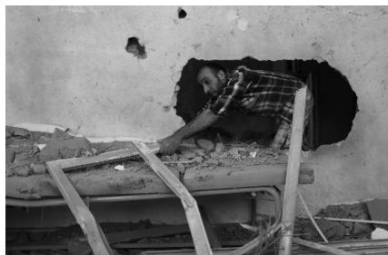
En palestinar på restene av en bygning etter et israelsk angrep, Jabalia camp