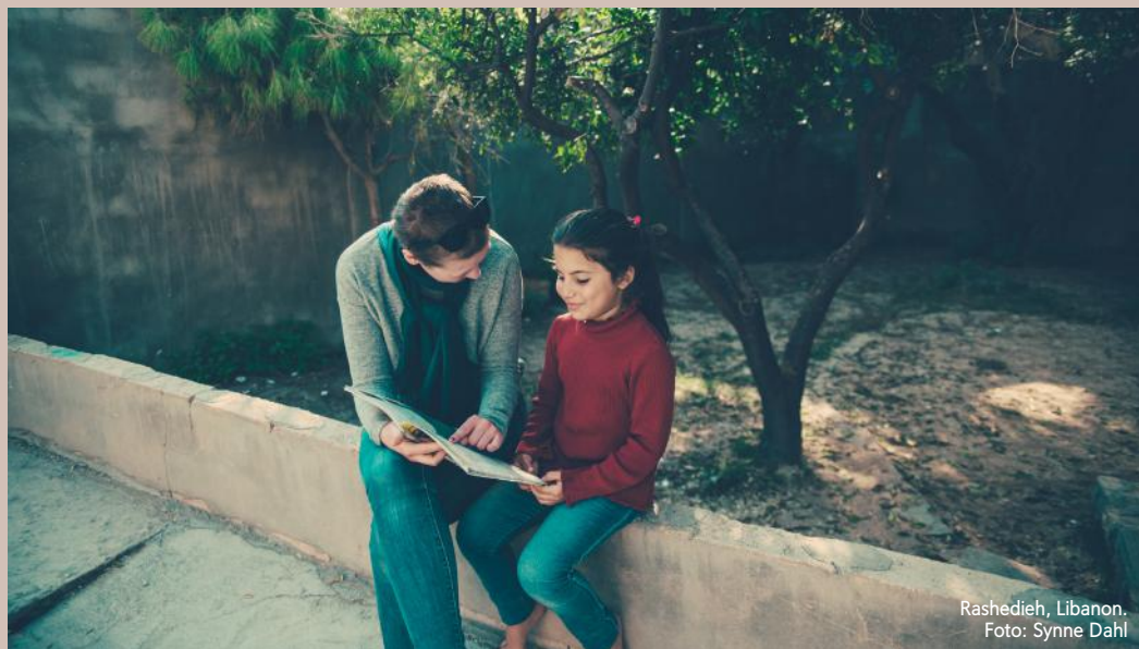
Rashedieh, Libanon.