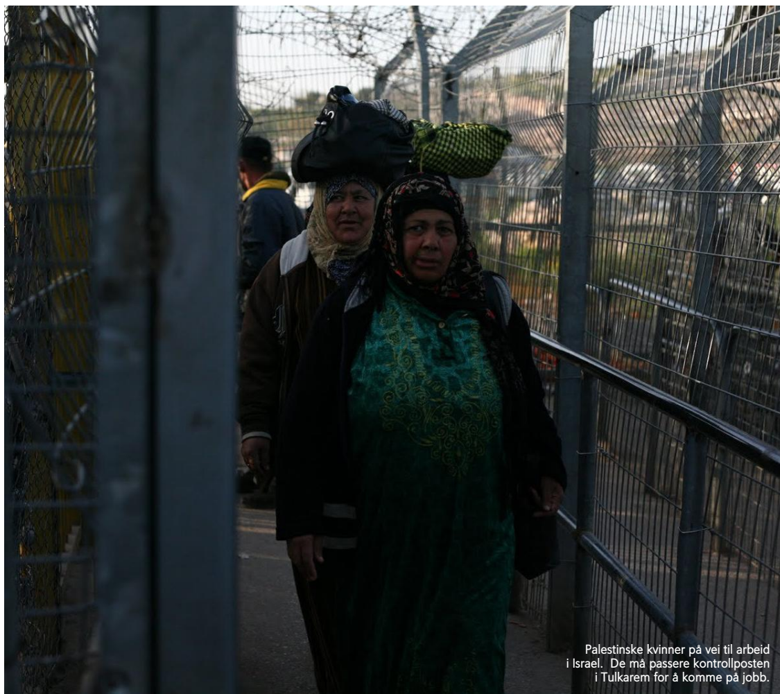
Palestinske kvinner på vei til arbeid i Israel. De må passere kontrollposten i Tulkarem for å komme på jobb.

derne på fabrikken sin egen fagforening. Dette var en viktig begivenhet i bygginga av NU.