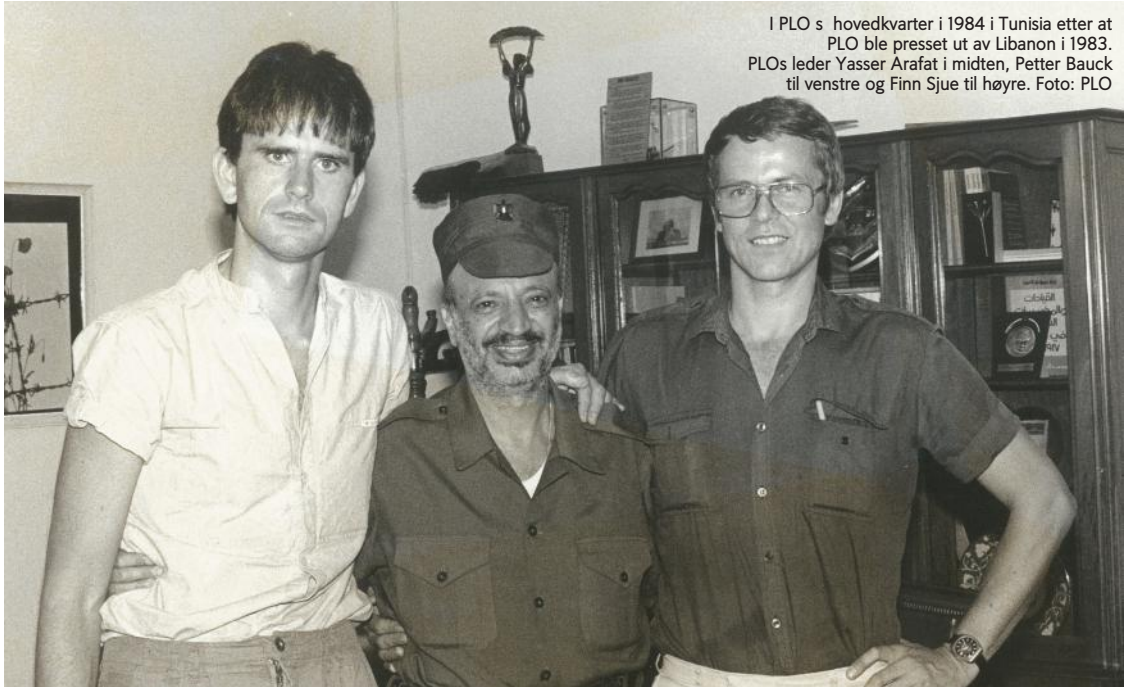
I PLO s hovedkvarter i 1984 i Tunisia etter at PLO ble presset ut av Libanon i 1983. PLOs leder Yasser Arafat i midten, Petter Bauck til venstre og Finn Sjøe til høyre.