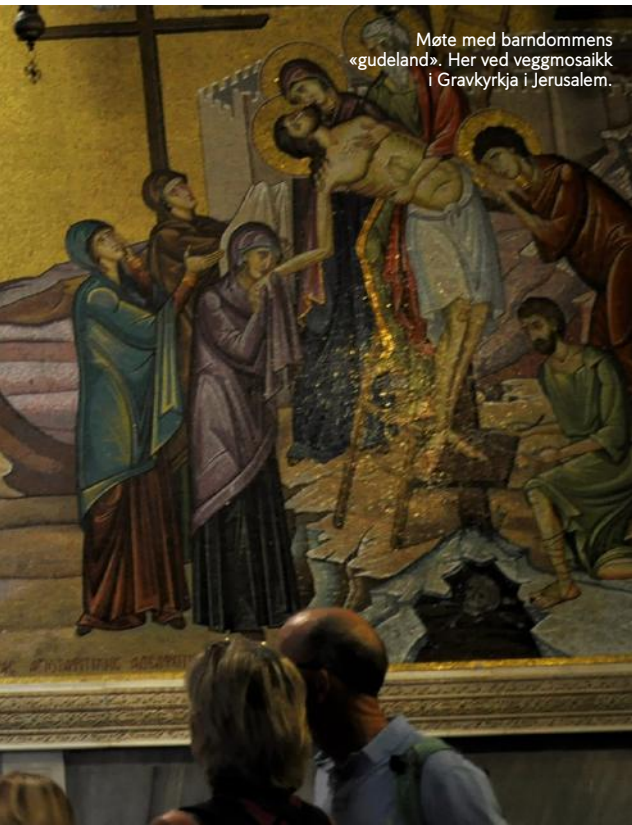
Møte med barndommens «gudeland». Her ved veggmosaikk i Gravkyrkja i Jerusalem.

dagleglivet var for dei som har gjeremåla sine på begge sider av kontrollpunkta. Små og større busettingsgrupper var det overalt der vi ferdast; i Jerusalem, Ramallah, Hebron og Betlehem, venteleg palestinske område.