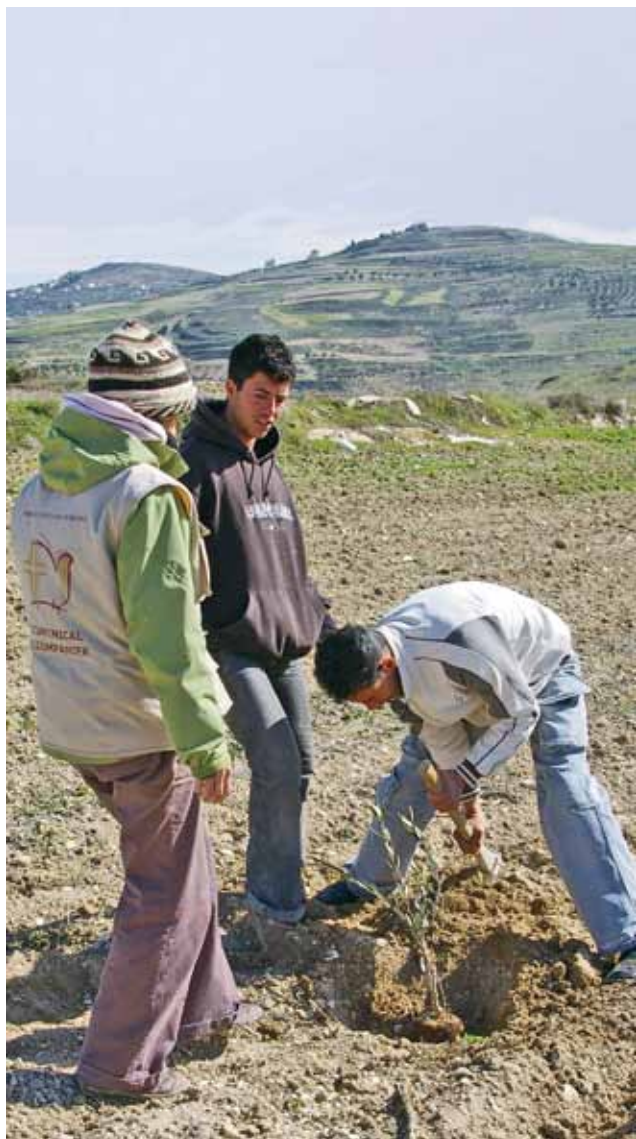
Internasjonal volontør planter oliventrær sammen med palestinsk ungdom på Vestbredden