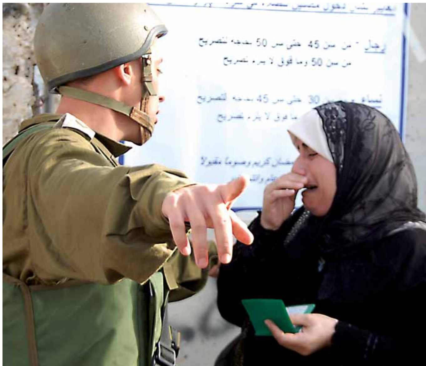
Palestinsk kvinne og israelsk soldat ved checkpoint