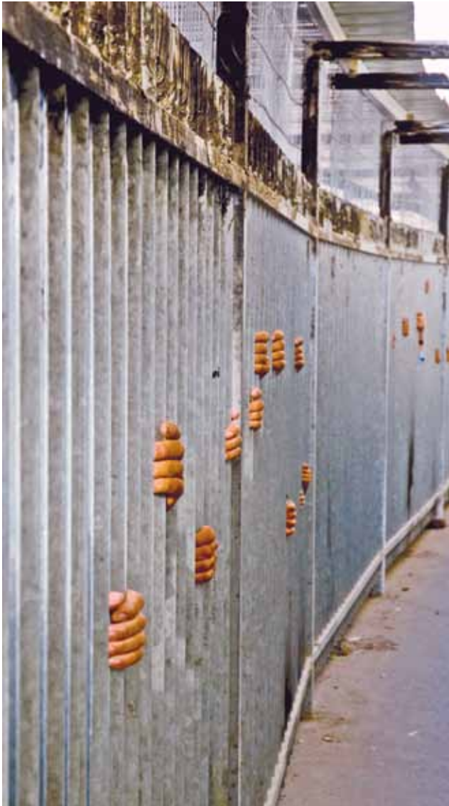
Palestinere venter i ckeckpoint ved Betlehem