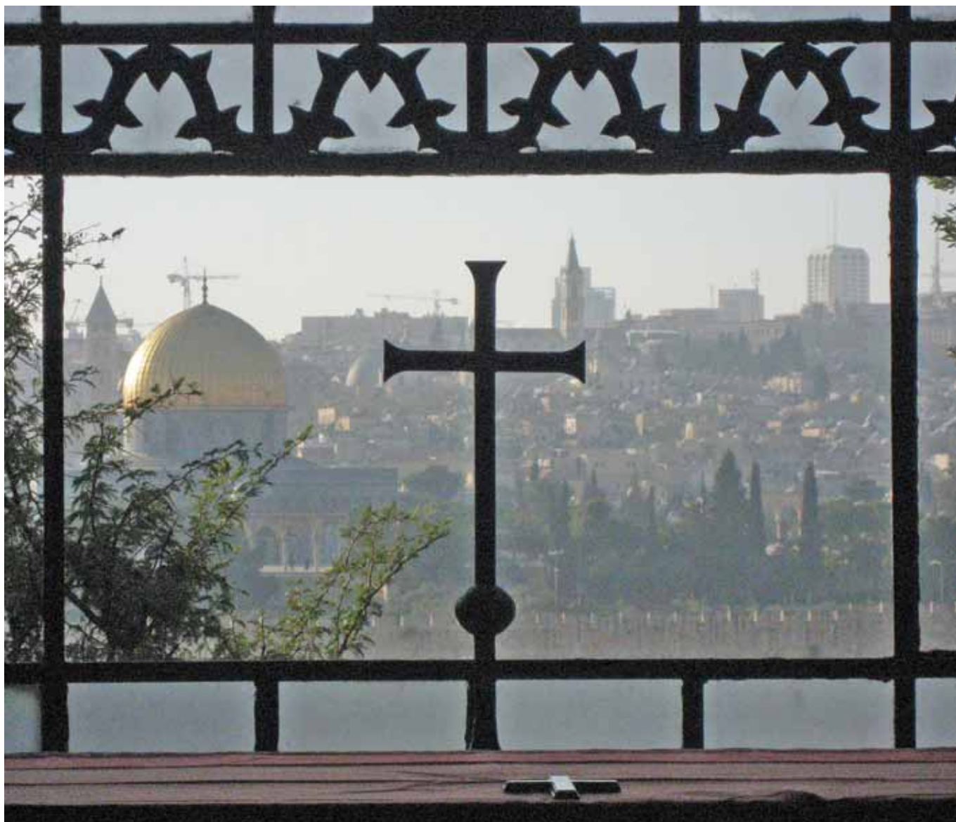
Jerusalem fra Tårekirken på Oljeberget