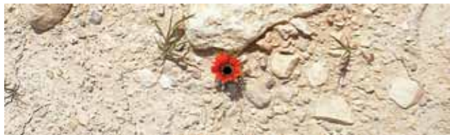
«Signs of Hope» - en blomst i tørr jord ved Tantur, Betlehem