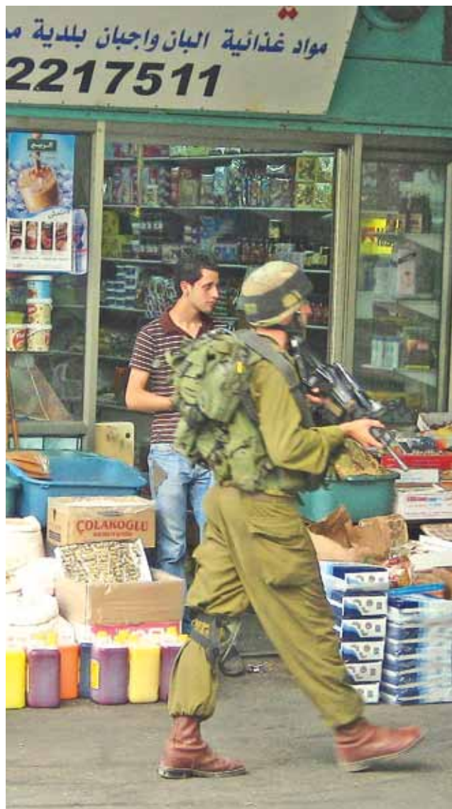
Israelske soldater patruljerer i gamlebyen i Hebron