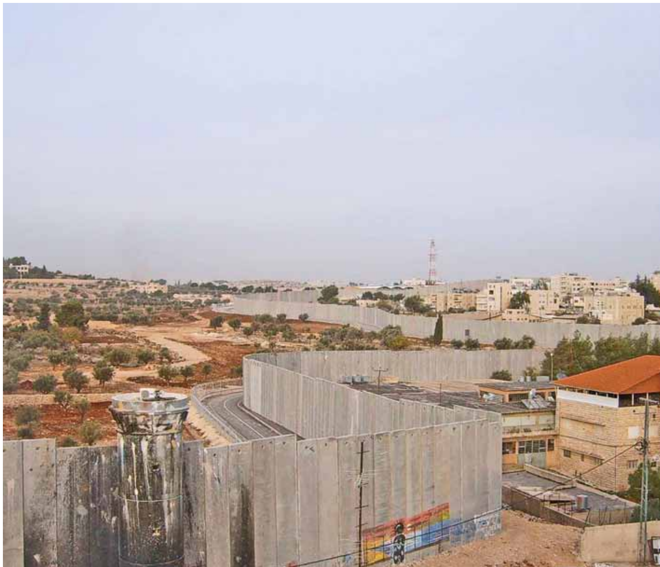
Muren ved Betlehem