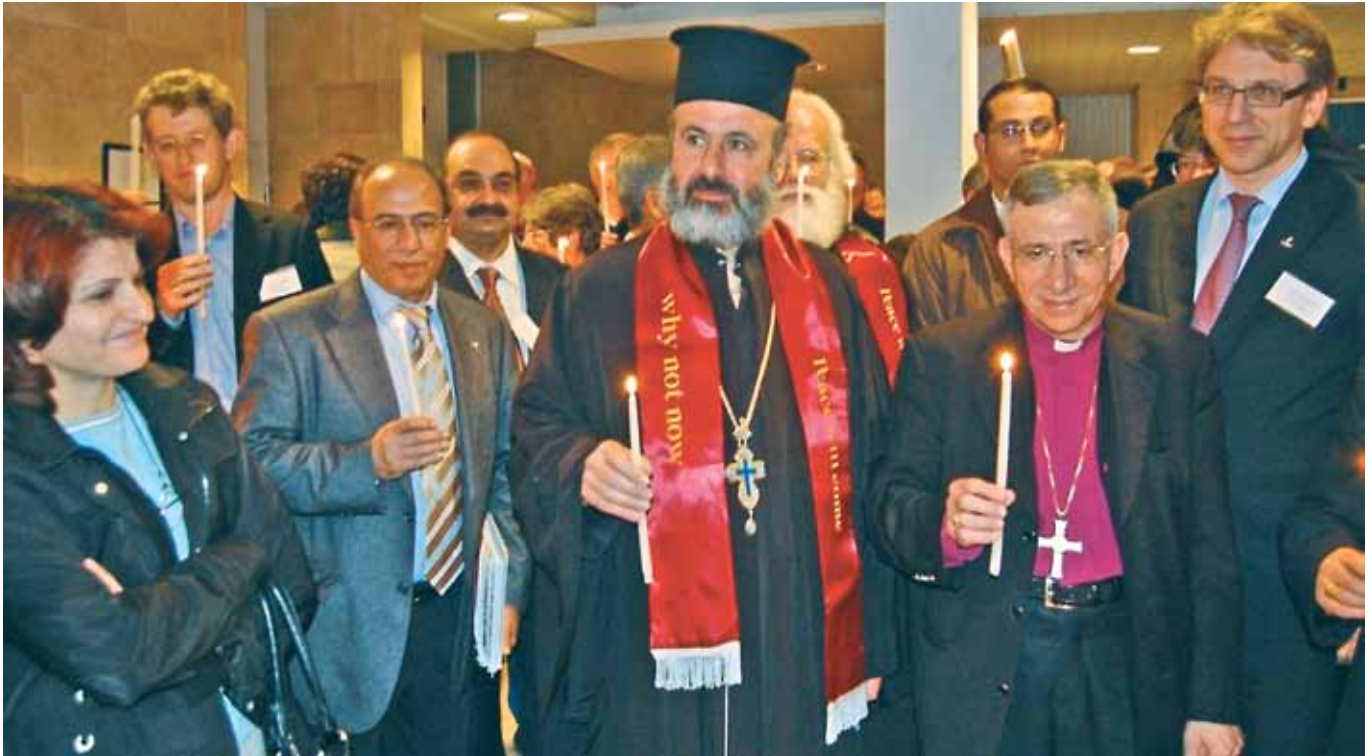
Lystening ved lanseringen av dokumentet Kairos Palestina 11. desember 2009