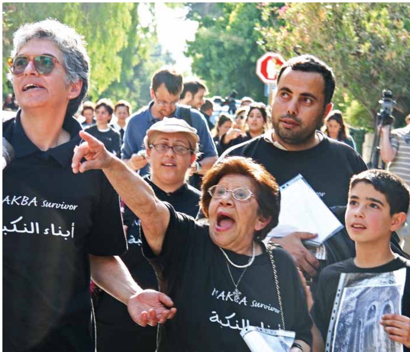
Palestinere markerer Nakba (katastrofen) ved 60årsmarkeringen i mai 2008