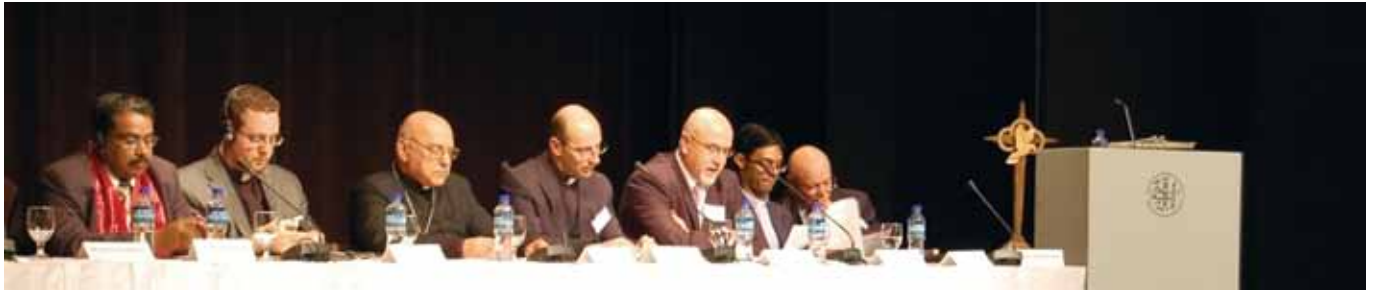
Fra lanseringen av det palestinske Kairos-dokumentet i Betlehem, 11.desember2010