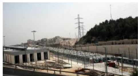
Bygging av stasjonsområde på palestinsk land. Foto: Lars Kalkes, Palkom FU oktober 2008

Jerusalem Light Rail: Med Veolia/Connex for Facts on the ground.